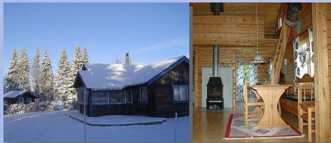
Ferienhäuser am See mit Sauna

Hotelzimmer und Apartments, Iglus und Blockhütten