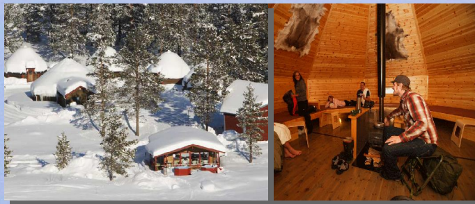
Samiland, ein Hütten- und Igludorf