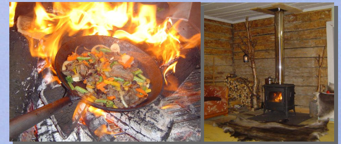
Spezialitäten in uriger Blockhütte